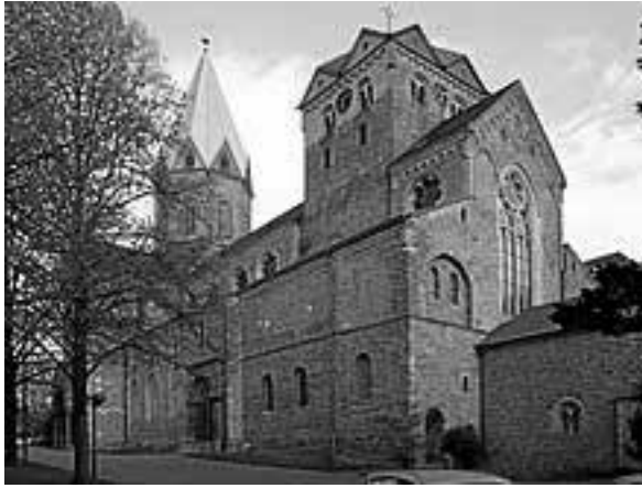
St. Ludger basiliek, Werden (D.)