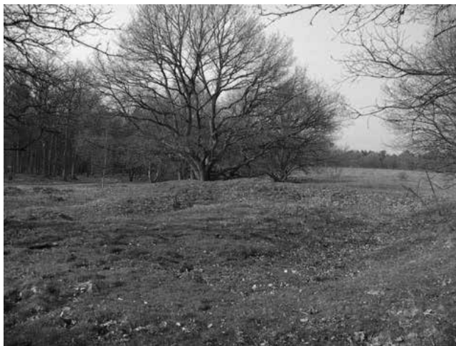
Locatie van de Wolfhezer kerk anno 2018