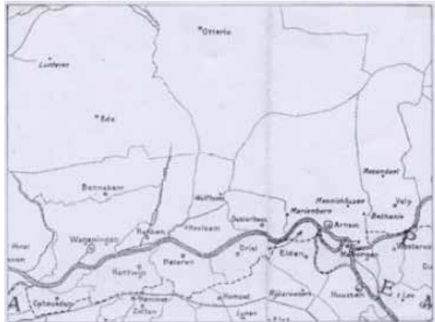
Veluwse en Betuwse parochies in het Rijngebied c.a. 1560

Hoe dat alles ook zij, het is m.i. wat ver gezocht dat Meinwerk zijn kerken (en de kapel) aan de limieten van zijn eigendommen zou bouwen. Het gebied is vrijwel leeg en nagenoeg onbewoond: hij had het niet nodig om “de grens op te zoeken” voor zijn kerk of kapel. Op de welbekende parochie-indeling van ca. 1560 (S. Muler Hzn. 1919) liggen de kerspelkerken op de Zuidzoom niet echt dichtbij de parochiegrenzen, maar misschien zijn die grenzen ondertussen aan de locaties van de kerken aangepast.