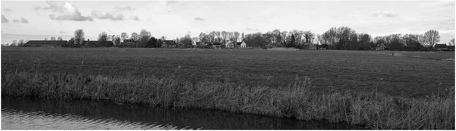
Silhouet van Toornwerd vanaf Middelstum

Allereerst is daar de opvallende naamovereenkomst tussen Toornwerd en Dorenwerd. Beide namen zouden in de middeleeuwse praktijk vermoedelijk gewoon naast elkaar zijn gebruikt ter identificatie van één en dezelfde plaats of familie.