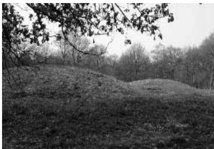
Twee grafheuvels aan de heerwech bij de Wolfhezer kerk

De Wolfhezer kerk staat op een voor de heidenen provocerende locatie, op een hoogte in het veld en omgeven door minimaal 16 tumuli, even opvallend en uitdagend als de St. Maartenkerk van Epe, in het graafschap Hamaland of in een “los” bezitsdeel van de familie. Deze kerk staat op een rechte lijn van ettelijke tientallen grafheuvels met een lengte van enige kilometers tussen Epe en Niersen bij Vaassen; de St. Maartenkerk is voorafgegaan door een houten kerk (14).