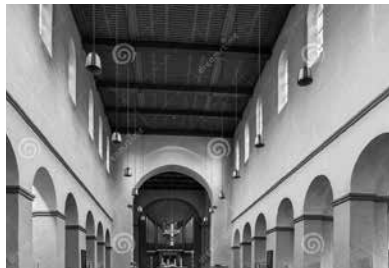
Abdinghofkerk Paderborn

Nu kom ik toe aan de godshuizen van Bennekom, Renkum en Wolfheze, die naar alle waarschijnlijkheid ongeveer tegelijkertijd zijn gebouwd.